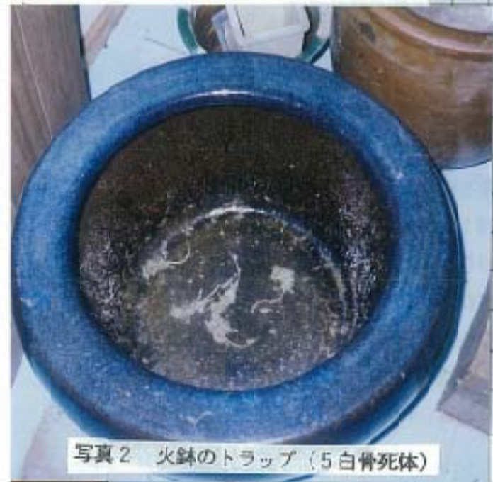
写真2 火鉢のトラップ (5白骨死体)