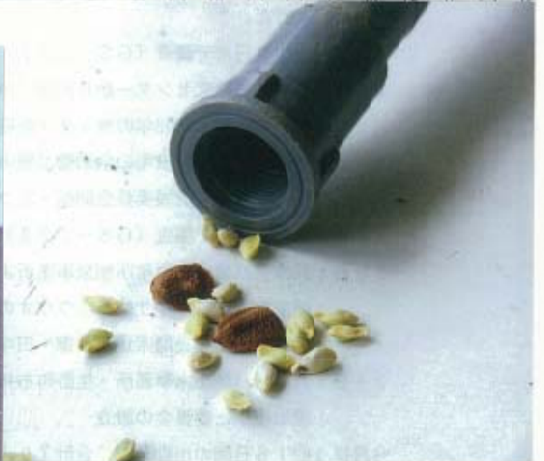
写真4 内径23mmのパイプにストックしたタネ