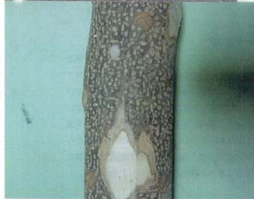
写真-5 山椒の木(直径5cm)の樹皮