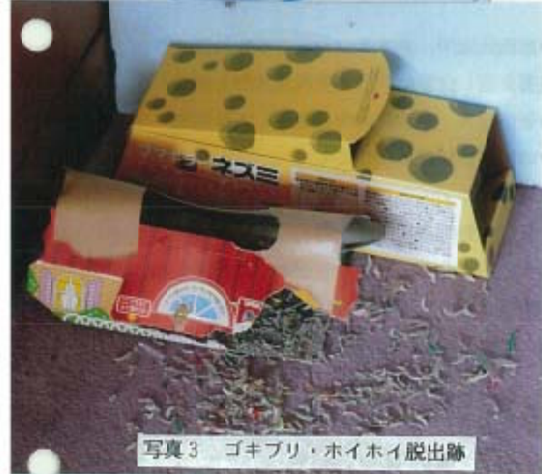
写真3 ゴキブリ・ホイホイ脱出跡