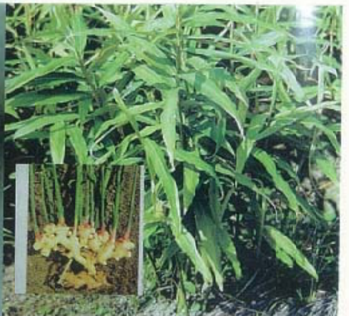
写真-6 生姜「岡山の薬草」(山陽新聞社)より