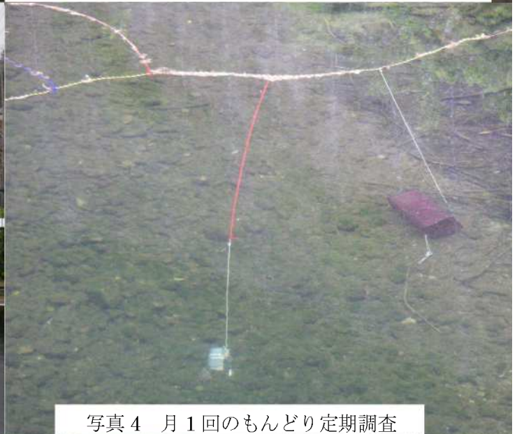
写真4 月1回のもんどり定期調査