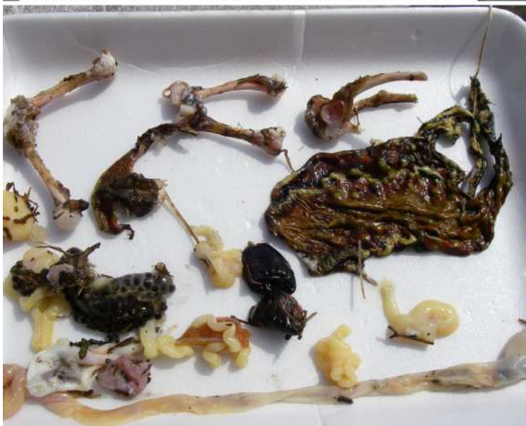
写真5 産卵場で皮を剥かれて食われたヒキガエル♀