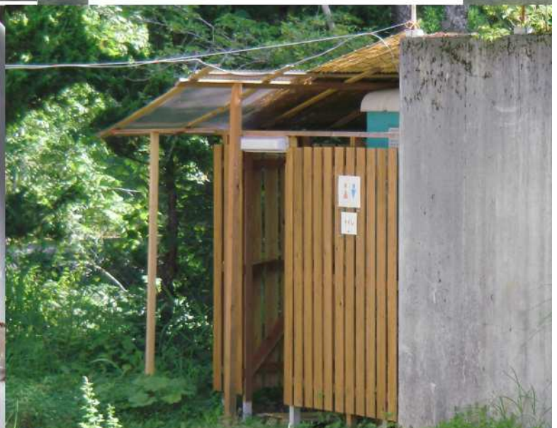
写真6 レンタルのトイレ4基を囲って