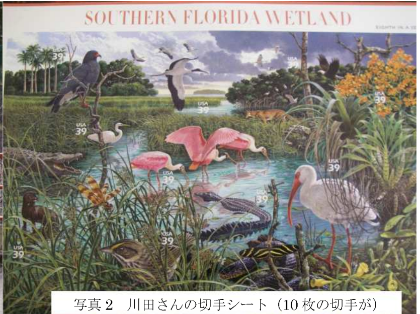
写真2 川田さんの切手シート (10枚の切手が)