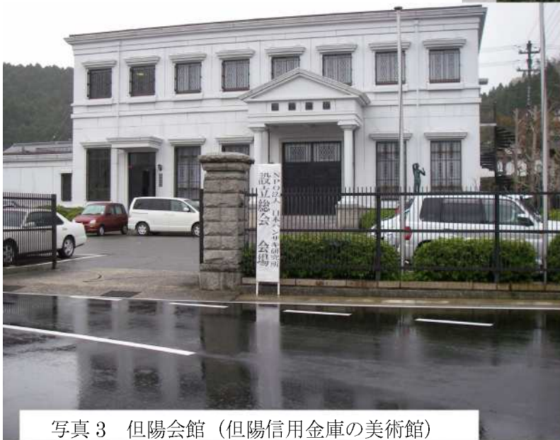
写真3 但陽会館 (但陽信用金庫の美術館)