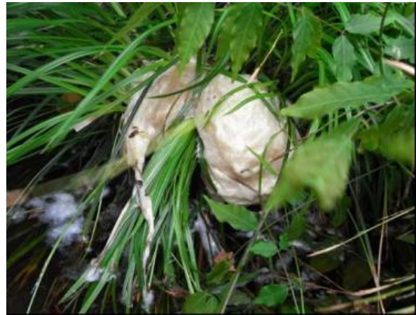
産みつけられた卵巣