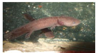
水槽には幼生もいます