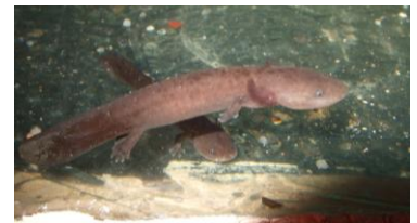
水槽には幼生もいます