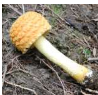
コナカブリベニツルタケ